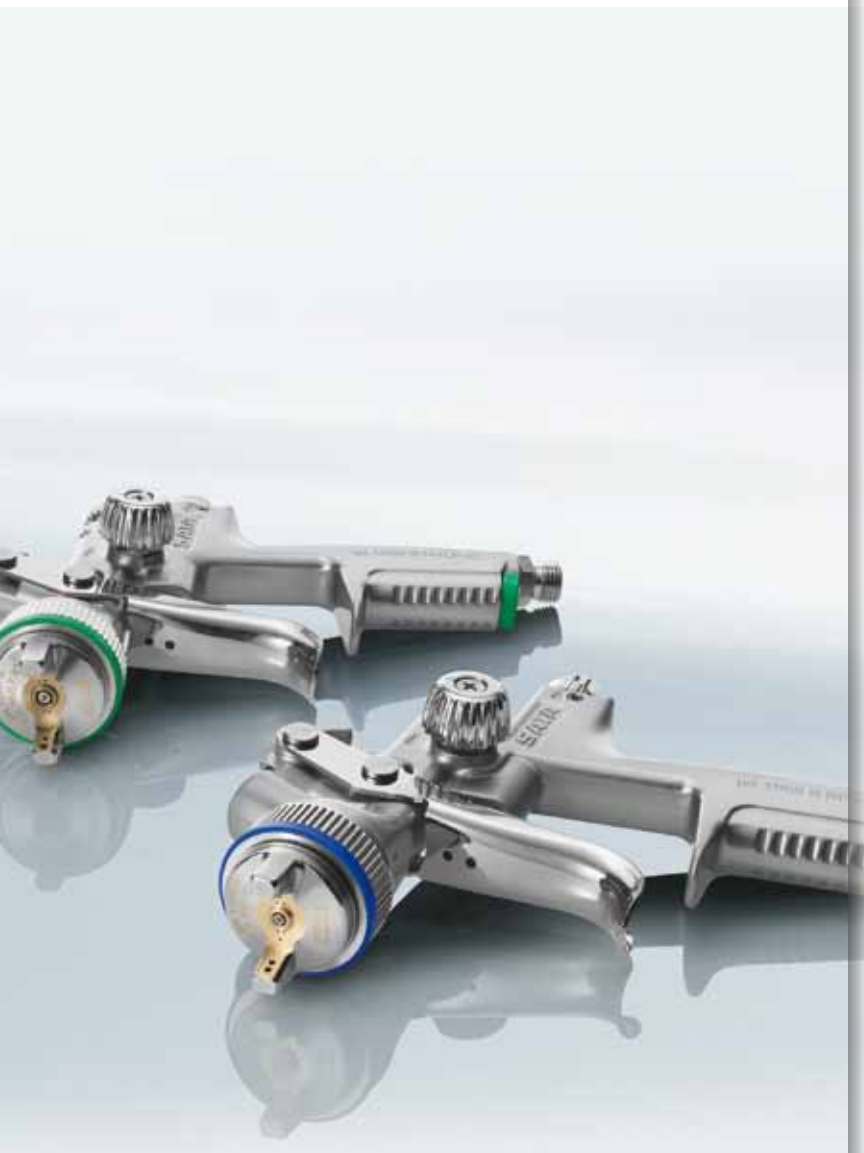
Имеются дополнительные аксессуары для специальных задач, например, окраски радиаторов.