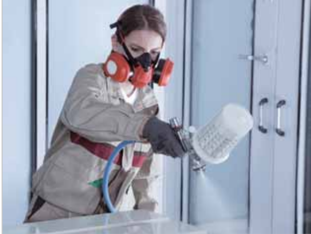
Широкий выбор диаметров дюз обеспечивает универсальность SATAjet 1000 B.